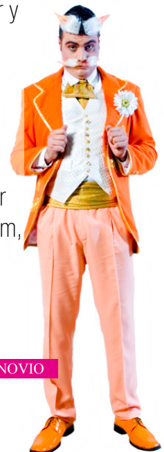
EL AMIGO DEL NOVIO