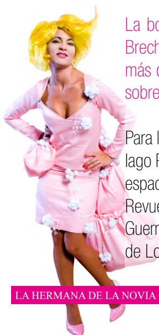
LA HERMANA DE LA NOVIA

Para la parte artística, contamos con un equipo actoral de primera línea, arropado por Iago Pericot, maestro y figura indiscutible del teatro catalán y nacional, en el concepto espacial con un desarrollo escenográfico de Bartolomé Ruano; en el vestuario, por León Revuelta, figura clave del cine y teatro español, y en la iluminación, por José Manuel Guerra, profesional de gran calidad y trayectoria impecable. Todo ello bajo la dirección de Los Profetas (Juan Ramón Pérez, Fernando Navas y Carmelo Alcántara).