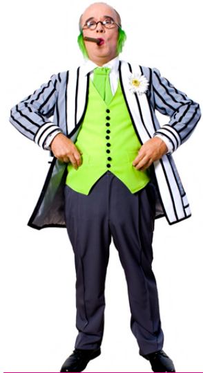
EL PADRE DE LA NOVIA